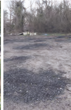
LES 3 TILLEULS

LES ÉLECTIONS ayant rendu à l'équipe sortante la mairie de Vauréal, le projet de constructions sur la forêt reste donc d'actualité, même si des « bémols » ont été apportés. « Le projet se fera dans le respect de la loi », a dit Sylvie Couchot, maire de Vauréal. Ce qui n'était pas le cas avant, une partie de la forêt ayant été déclassée illégalement lors du passage du POS 1 au PLU 2 en 1994 !