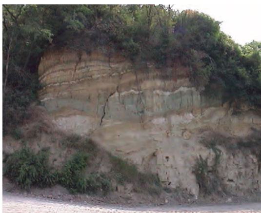
FRONT DE TAILLE EN 2005, MAINTENANT SOUS LE REMBLAI.

L'association EVA 2 s'est battue dès le début du projet de remblaiement de cette ancienne carrière, pour tenter de conserver des biotopes remarquables présents (inventaire Znieff 3 effectué en 1997-1998) et, surtout,