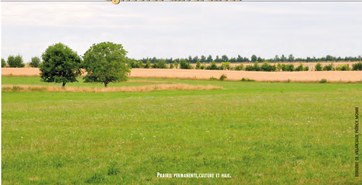
PRAIRIE PERMANENTE, CULTURE ET HAIE.