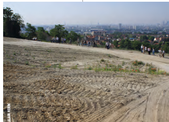
VISITE DE LA DERNIÈRE CLIS EN 2010.