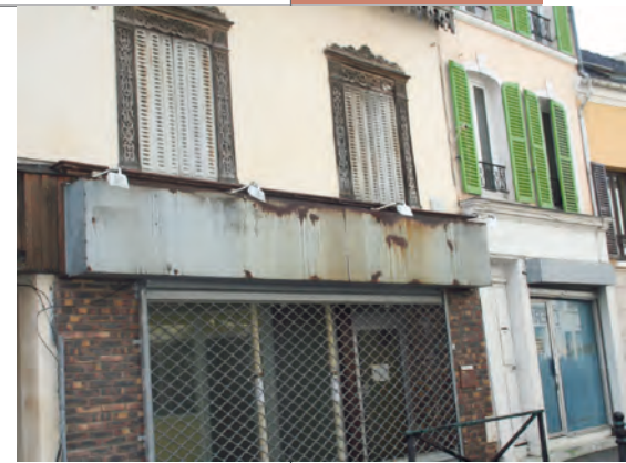
COMMERCES DU CENTRE-VILLE DE GONESSE, SEPTEMBRE 2014.

Dire Non à EuropaCity n'est pas dire non à tout, mais dire Oui à la possibilité d'inventer une nouvelle société où il fera bon vivre .