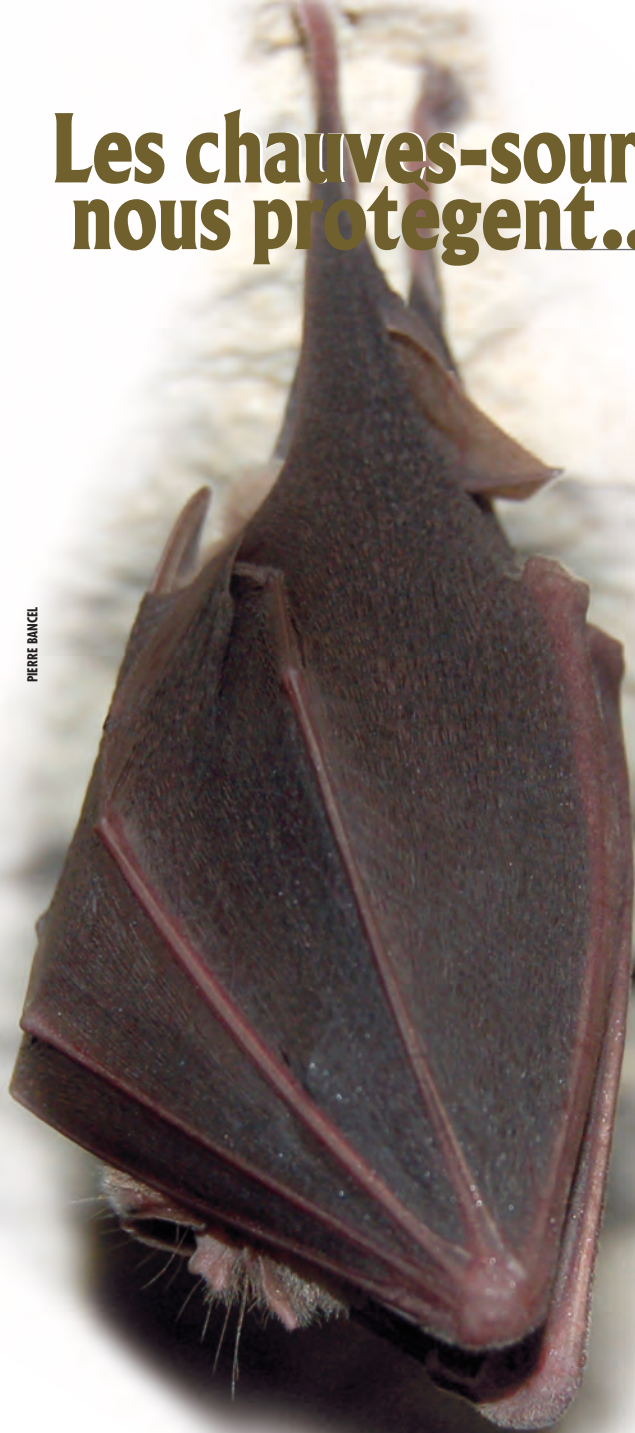
GRAND RHINOLOPHE EMBALLÉ DANS SES AILES (CHAUSSY).