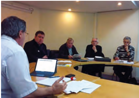
EXTRAIT DE 95.TELEF.TV