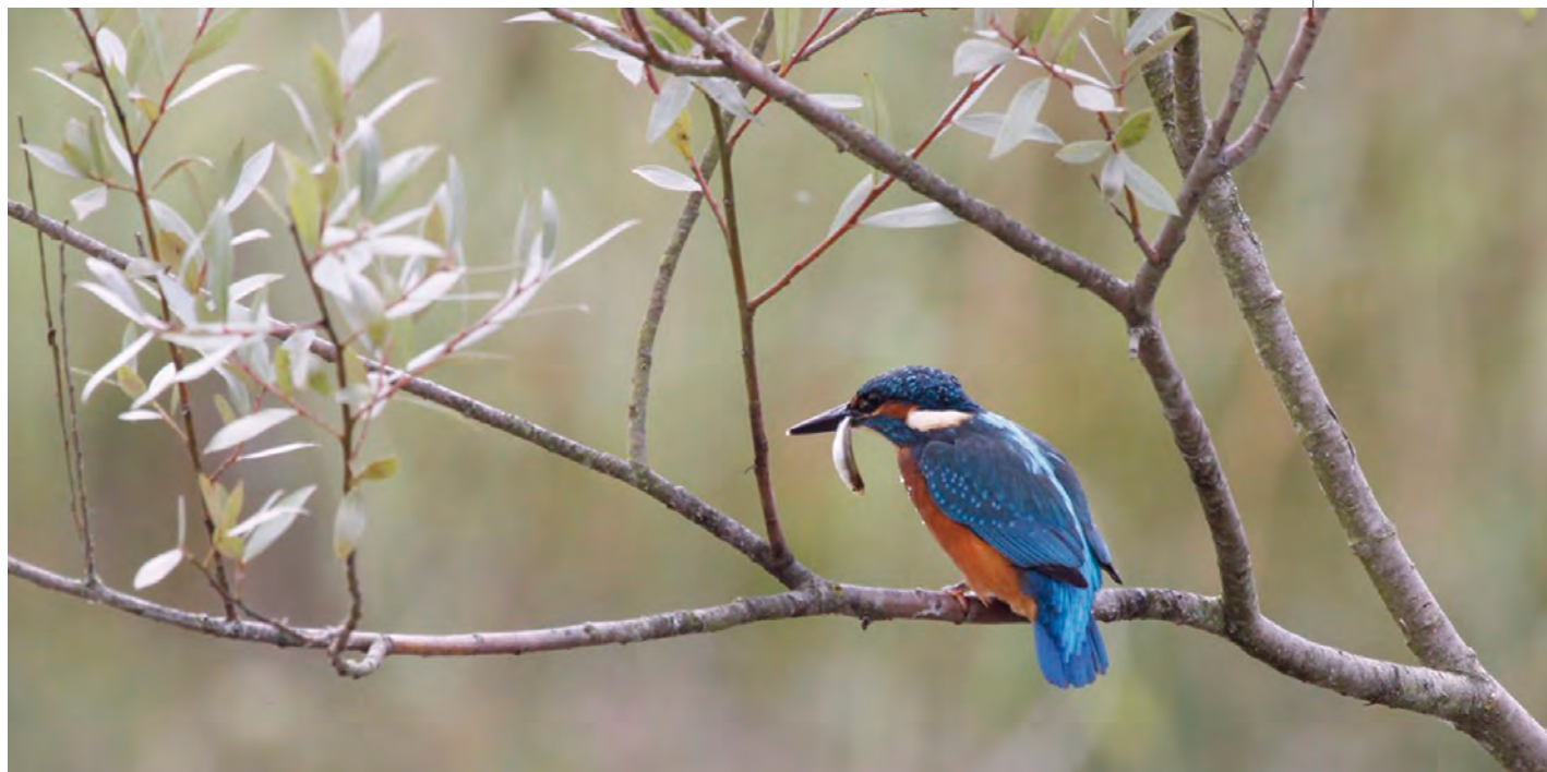
AVEC L'AIMABLE AUTORISATION DE © CHRISTIAN MARS

Enfin, il n'est pas prévu de zone de compensation à la disparition des trois hectares de zone naturelle. Dans le «meilleur des cas», c'est-à-dire si vraiment une compensation devait être envisagée, elle pourrait être réalisée dans les hauts de Bezons... Nous sommes ici en bords de Seine sur une trame verte et bleue... Le martin-pêcheur devrait donc se passer d'eau !