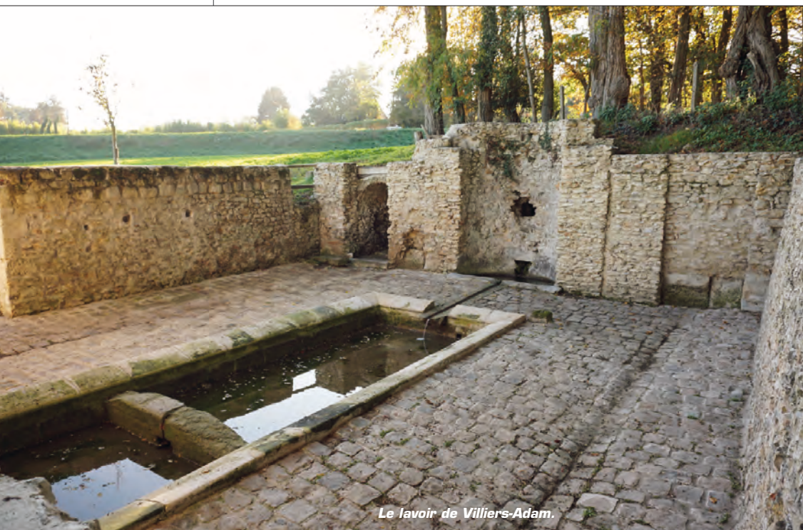
Le lavoir de Villiers-Adam.