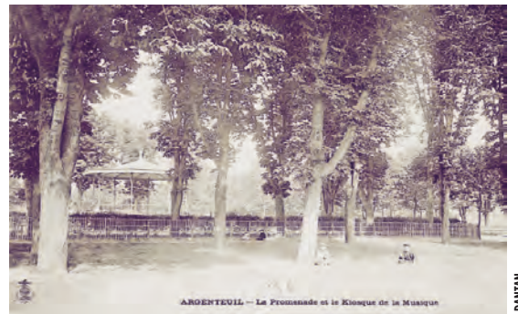
PROMENADE PRÈS DES BERGES DÉBUT XX e SIÈCLE.

Après l'assèchement du bras mort, l'île était considérée comme un pré communal, où le bétail broutait