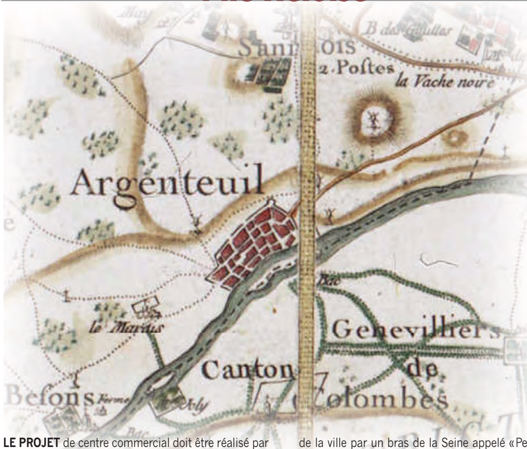
CARTE DE CASSINI 1780

LE PROJET de centre commercial doit être réalisé par un promoteur auquel le conseil municipal a autorisé la vente de ce terrain qui appartenait à la ville. Il sera également construit autour de ce multiplexe des restaurants et certains commerces, d'ici à 2019.