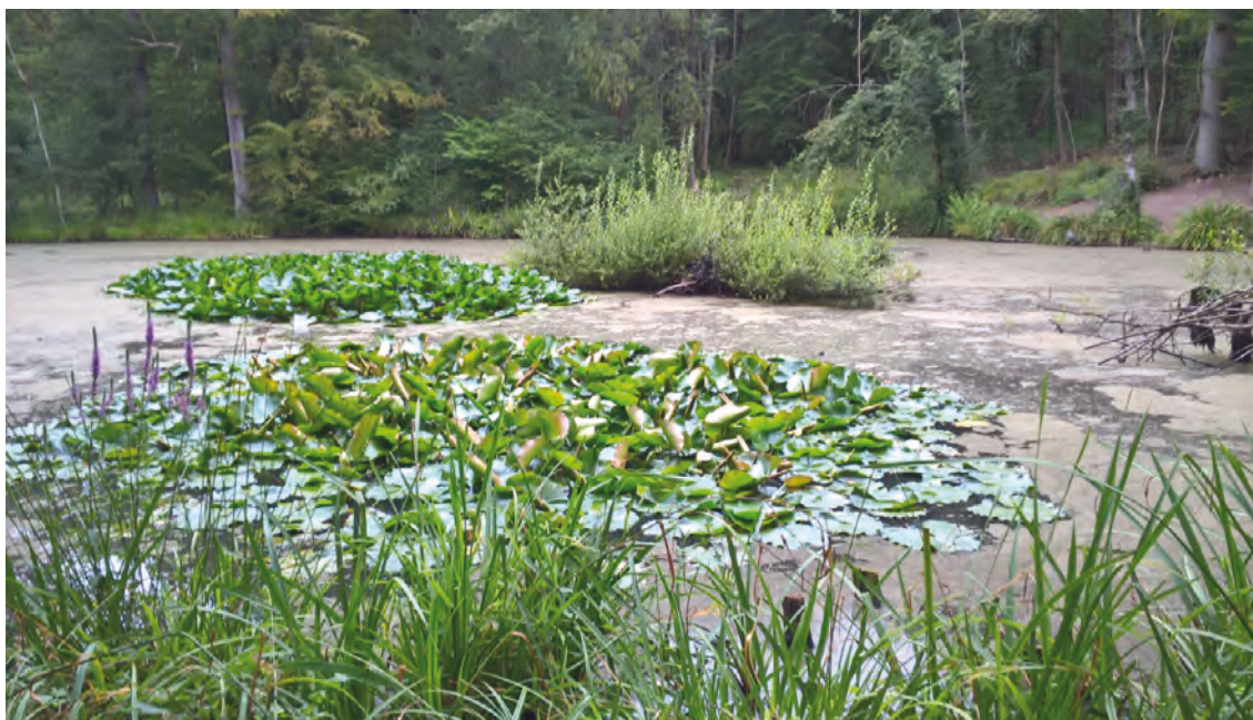
Carnelle. Mare des Sylphes, 11 août 2016.

LA DESTRUCTION des habitats est la première cause de disparition des espèces et de dégradation de la biodiversité. Les amphibiens sont en première ligne des espèces menacées. C'est la raison pour laquelle la SNPN 1 a lancé, en 2010, un programme d'inventaire des mares* d'Île-de-France, financé par la Région.