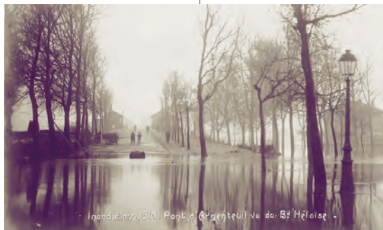
CRUES DE JANVIER 1910