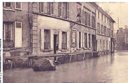
CRUES DE JANVIER 1910 BOULEVARD HÉLOÏSE.

C'est maintenant une zone végétalisée, dans l'alignement du marché Héloïse qui est prolongé par un espace arboré très prisé par les habitants, et qui sert de promenade plantée et à différentes manifestations de plein air. Le souhait de la municipalité actuelle est de rendre les berges de la Seine accessibles à tous, car elles ont été rendues célèbres par les peintres impressionnistes connus dans le monde entier (Monet, Pissarro, etc.).