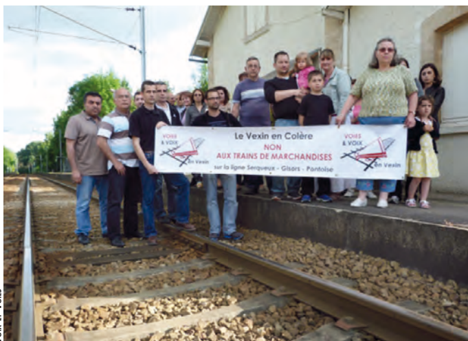
VOIX ET VOIX

L'association Voies et Voix en Vexin monte au créneau et organise des réunions de protestation, dans toutes les gares citées, avec les élus. Pas question de fermer